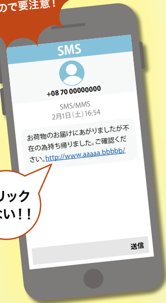
【宅配業社の不在通知を装ったSMSの例】